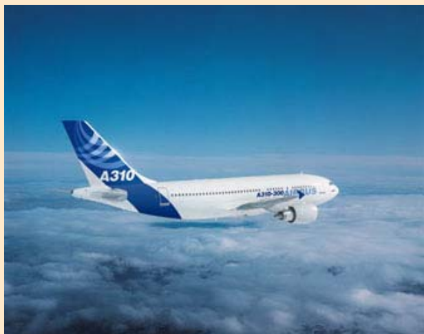
Airbus A 310