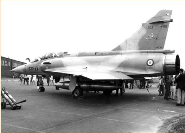
Mirage 2000 B

Côté civil elle réalisa les atterrisseurs du Falcon 50. Eram, de son côté, se plaça sur les trains des hélicoptères SA 360/361 Dauphin et SA 365 Dauphin 2. Cependant, les événements les plus marquants concernèrent les programmes Airbus et l'avènement des freins carbone sur le mirage 2000.