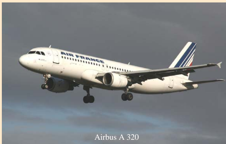
Airbus A 320