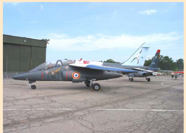
Alphajet II/8 « Nice »

Cette décennie fut caractérisée par une intense activité des bureaux d'études et des succès sur de nombreux programmes. Nous ne mentionnons ici que les plus importants. Ainsi sur les programmes militaires, qui continuaient à jouer un rôle essentiel, notamment par la particularité des contraintes techniques qu'ils imposaient, Messier-Hispano-Bugatti fut sélectionnée pour les atterrisseurs, les roues, les freins de l'Alphajet et du Mirage 2000, ainsi que pour les atterrisseurs du Super-Etendard et de l'Hélicoptère AS 332 Super-Puma.