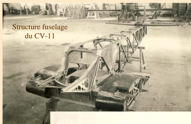
Structure fuselage du CV-11