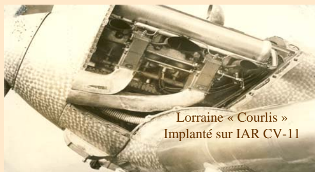
Lorraine « Courlis » Implanté sur IAR CV-11

Si le fuselage était en partie métallique, jusqu'à l'arrière du cockpit, le reste de la structure était en bois et entoilé, comme les ailes et les empennages. L'avion fut d'abord équipé d'un moteur Lorraine « Courlis » de 12 cylindres qui développait 600 ch.