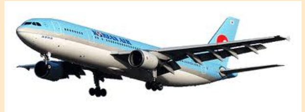
Airbus A 300 B4

A noter qu'en raison des difficultés faites à Airbus par la Port of New York Authority sur la résistance de la piste de l'aéroport de La Guardia, il fallut lancer une version spéciale des atterrisseurs principaux comportant un balancier allongé, afin d'augmenter la distance entre la paire de roues avant et la paire de roues arrière.