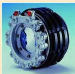
Frein carbone-carbone Mirage 2000

Comme nous l'avons déjà mentionné, il y eut en France depuis le milieu des années 1960 et surtout tout le long des années 1970, une intense activité de recherches portant sur l'utilisation du carbone pour la réalisation de disques de freins. Après bien des essais en laboratoire et sur avion, de différentes formules, les équipes de Messier-Hispano-Bugatti et de la SEP réussirent à mettre au point des disques en carbone-carbone adaptés au frein du Mirage 2000, aboutissant à l'homologation de ce frein et à son adoption sur cet avion peu avant 1980.