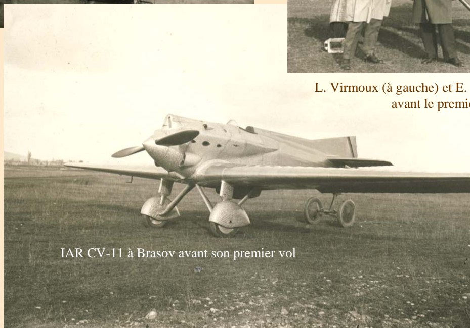
IAR CV-11 à Brasov avant son premier vol