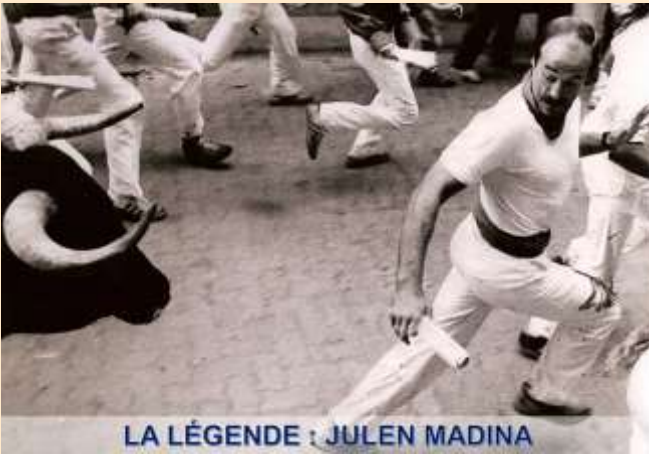
LA LÉGENDE : JULEN MADINA

Naturellement, avant la calle Estafeta, alors que nous étions proches de la plaza del Castillo, nous sommes allés saluer Ernest, tout au moins sa statue en bronze, placée dans « el ricón de Hemingway », situé au café Iruña.